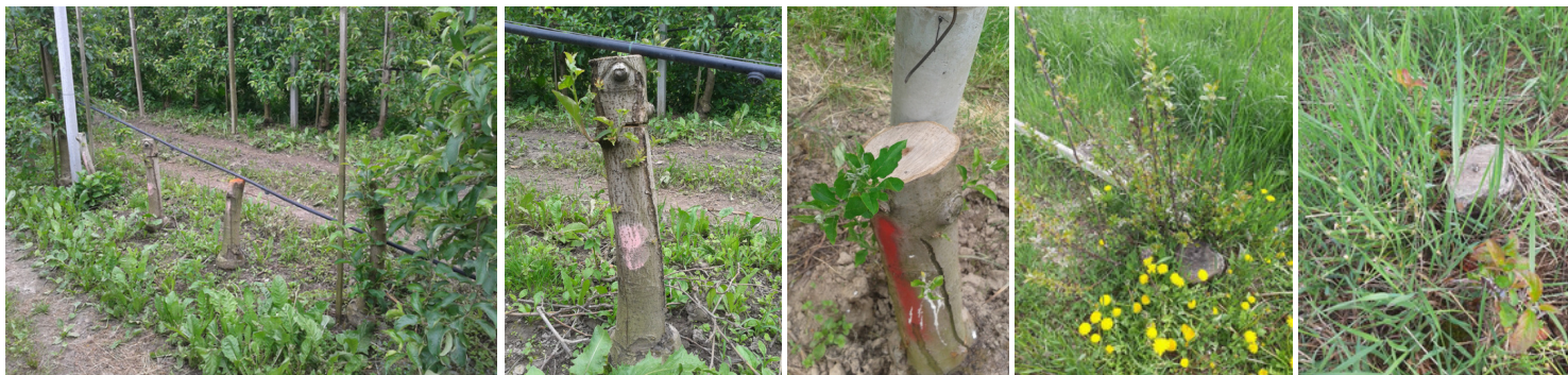
Ceppaie ancora piantate nel terreno e vitali

A titolo di esempio, di seguito si illustrano delle situazioni di estirpo incompleto che possono essere assoggettate a regime sanzionatorio.