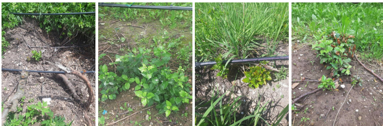
Ricacci sviluppati da residui radicali ancora vitali