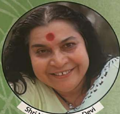
Shri Mataji Nirmala Devi