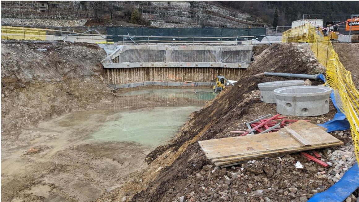
Fotografia scattata il 9 dicembre 2023

SOTTOPASSO AGRICOLO ALLA S.S. 240 SULLA VARIANTE DI MORI OVEST. PERCHÈ IL CANTIERE È FERMO E ALLAGATO DA MESI E I LAVORI NON SI SONO ANCORA CONCLUSI?