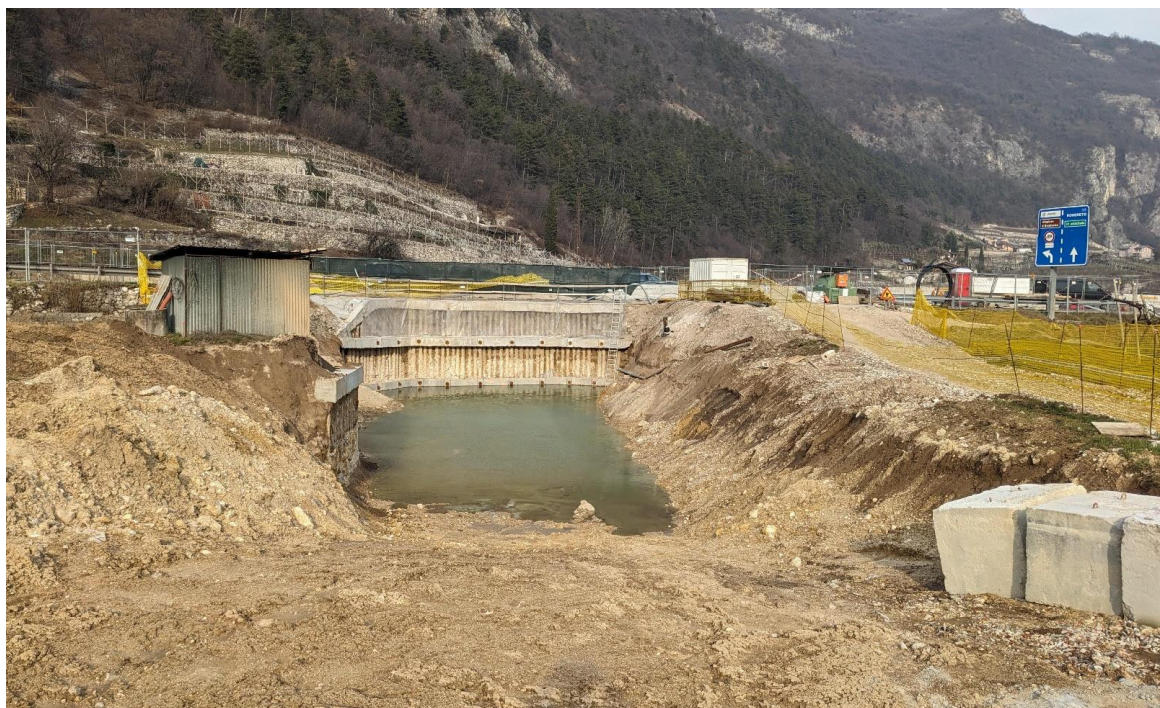
Fotografia scattata il 18 febbraio 2024