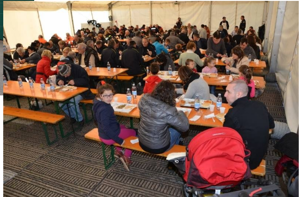
Fornitura del Vitto